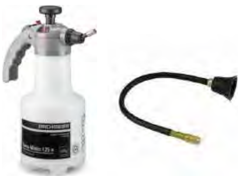
1.25 lt. Drucksprayer mit 80cm Lanze

Weil der Desinfectant FS36 keine Gefahrenstoffe hat, muss er auch nicht gespült werden. Mit einem PH Wert von 7.5 entfällt auch das neutralisieren. Darum können wir den Reinigungsprozess beschleunigen, weil die Einwirkzeit im Trocknungsschrank stattfindet und die Wirkstoffe im Gegensatz zu Alkohol über Monate eine aktive und nachhaltige Rolle spielen. (ohne uns bekannte Schäden) BAG Zulassung seit 1992 und auch seit 1992 im Einsatz zur Maskendesinfektion!