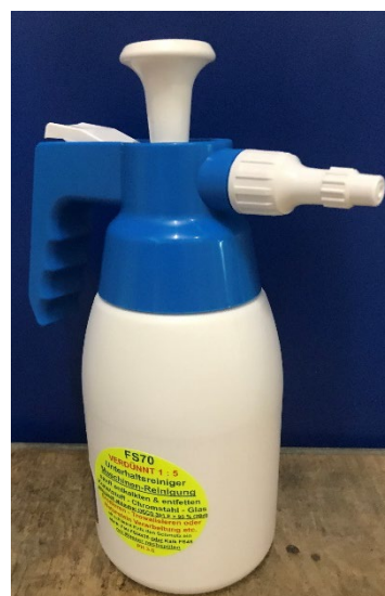
FSSG (Werbefrei) mit Platz zum labeln

Display Karton: 30 Stk. Minisprayer gefüllt