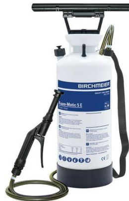
Foam Matic 5E BFM5P à CHF 247.50