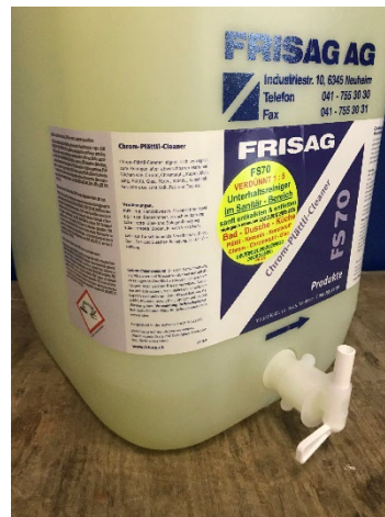
Lagerstellung zu ↑