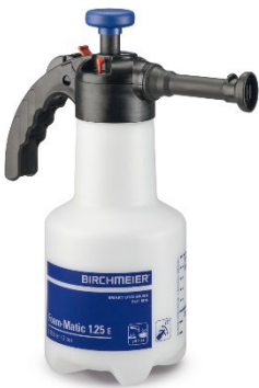
Foam-Matic 1.25E BFM125 à CHF 71.60

für mobile Arbeitseinsätze, Gouvernanten, Montageure, Reinigungsinstitute etc.