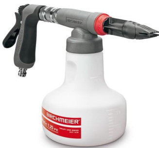
Vario-Matic 1.25PE BIMVM à CHF 215.95