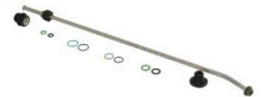
Option 50cm Lanze BFM5EL à CHF 39.50