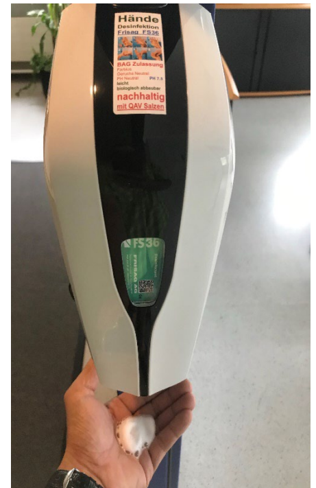
FSCF / CS / CT