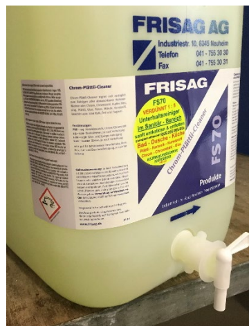
FSHA Auslaufhahn ↓