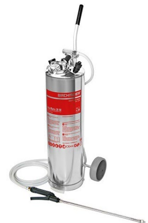
Indu-Matic 20M BIM20M à CHF 1'188.60

mit Trockenschaum werden Einwirkzeiten verlängert